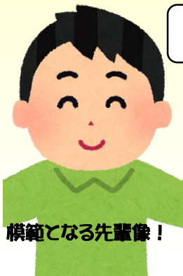
模範となる先輩像！